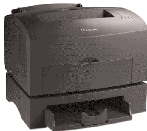
Lexmark E321 avec magasin facultatif de 250 feuilles